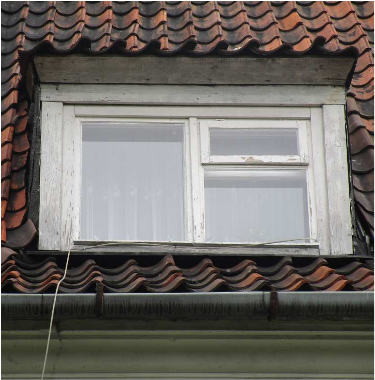
Foto 2 Widok na jedno ze starych okien przeznaczonych do wymiany