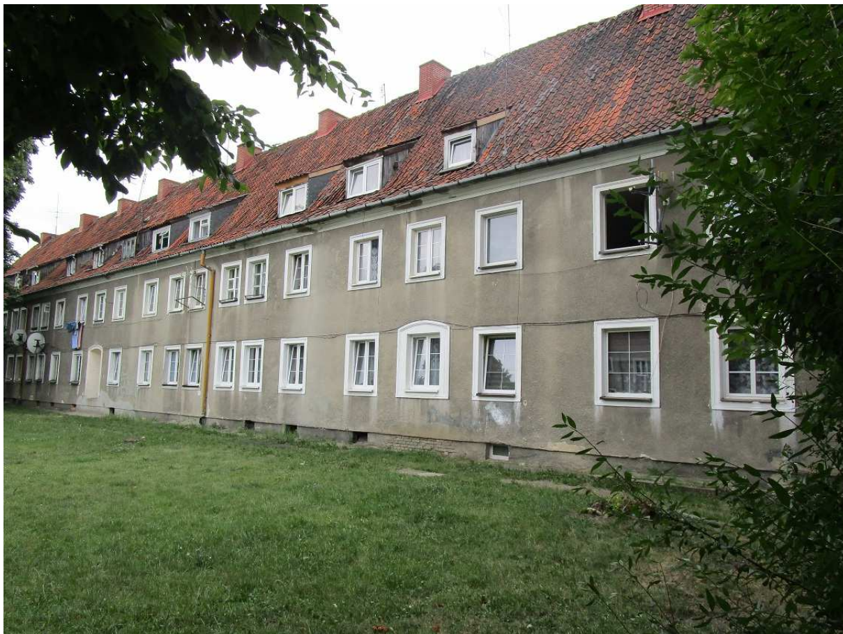
Foto 1 Widok ogólny na elewację

Budynek murowany posiada dwie kondygnacje nadziemne i jedną podziemną oraz poddasze użytkowe. Budynek wzniesiony metodą tradycyjną z cegły ceramicznej w latach 1940 - 44. Dach wielospadowy.